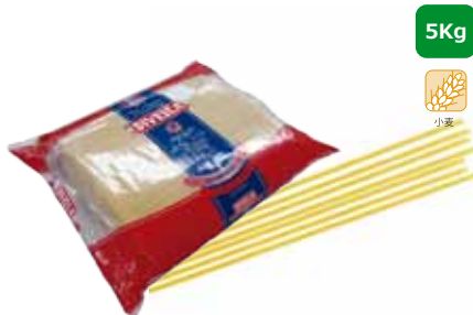
#09 スパゲッティーニ (φ約1.55 mm) 参考ゆで時間 6分 [606-162] オープン価格 5Kg/3 8005121082098