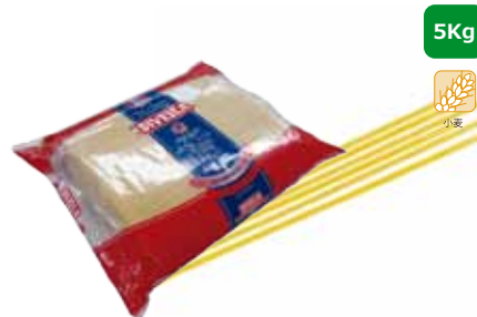
#10 ヴェルミチエツリーニ (φ約1.40mm) 参考ゆで時間 5分 [606-164] オープン価格 5Kg/3 8005121082104