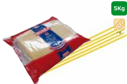
#08 スパゲッティ リストランテ (φ約1.75mm) 参考ゆで時間 7分 [606-163] オープン価格 5Kg/3 8005121082081