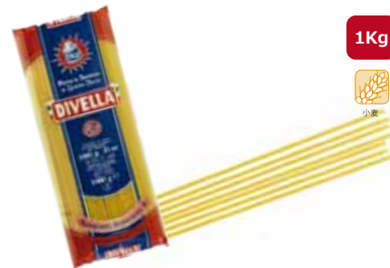
#09 スパゲッティーニ (φ約1.55 mm) 参考ゆで時間 6分 [606-161] 560円 (消費税別) 1Kg/12 8005121010091