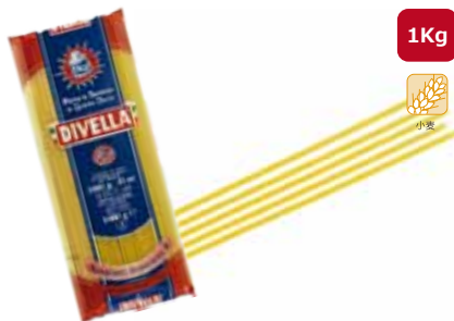
#08 スパゲッティ リストランテ (φ約1.75mm) 参考ゆで時間 7分 [606-165] 560円 (消費税別) 1Kg/12 8005121010084